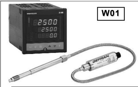
软杆组态用于要求更高热隔离或难以安装的情况