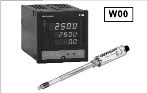
硬杆组态使安装方便快捷