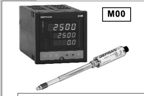
硬杆组态使安装方便快捷