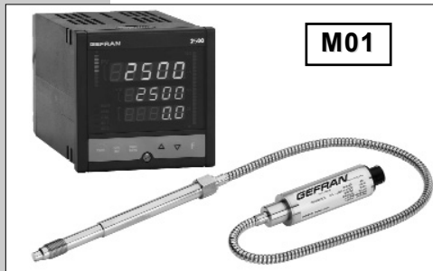
软杆组态用于要求更高热隔离或难以安装的情况